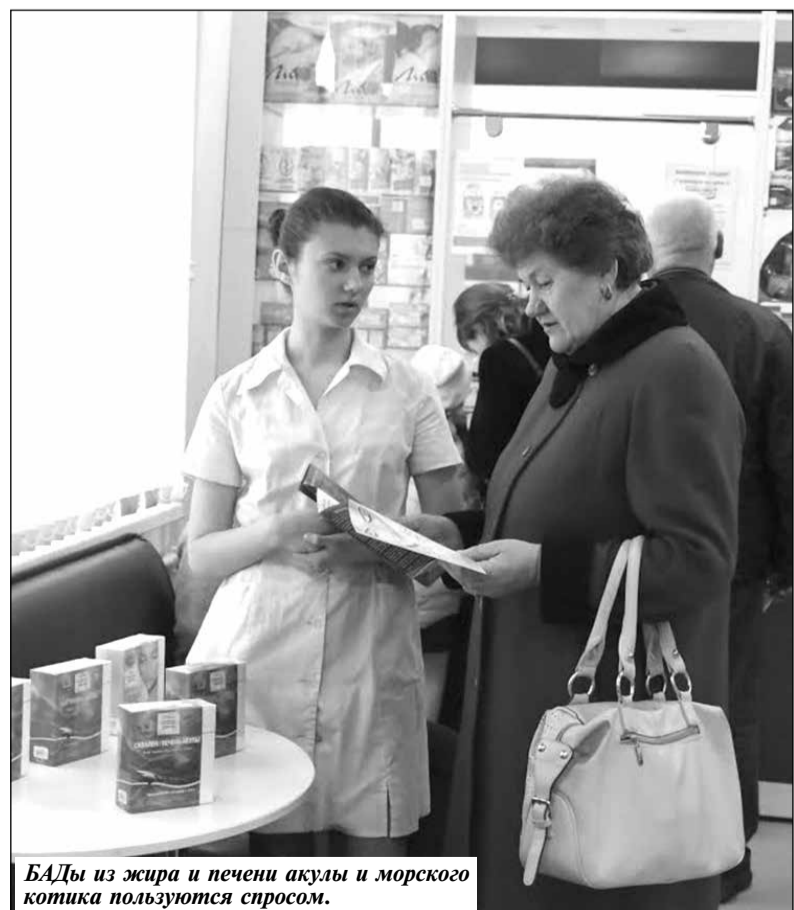
БАДы из жира и печени акулы и морского котика пользуются спросом.