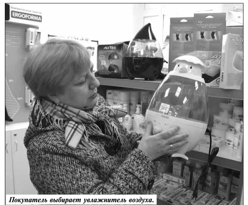
Покупатель выбирает увлажнитель воздуха.

тринах выставлена лишь малая часть лекарственных средств безрецептурного перечня. Работа организована так, чтобы не было очередей, чтобы человека обслужили быстро и при необходимости проконсультировали толково. Для региональных и федеральных льготников определено специальное окно. Проблем с обеспечением лекарствами этих категорий, по словам заведующей, в настоящее время нет. Фармацевты стремятся работать с ними оперативно и внимательно. Соблюдение профессиональной этики, деонтологии, вежливость, компетентность – неотъемлемые качества сотрудников. Коллектив в основном молодежный. Выпускники Брянского медицинского колледжа, пройдя практику, считают большой удачей остаться здесь работать. Ветераны, а опытных специалистов очень ценят, не скупясь, делятся своими знаниями с теми, кто только начинает работать. Сориентироваться в огромном ассортименте готовых лекарственных форм помогает компьютерная сеть, без которой сегодня невозможно представить деятельность современного фармацевтическо-